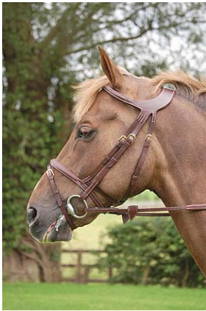
The Difference Collection